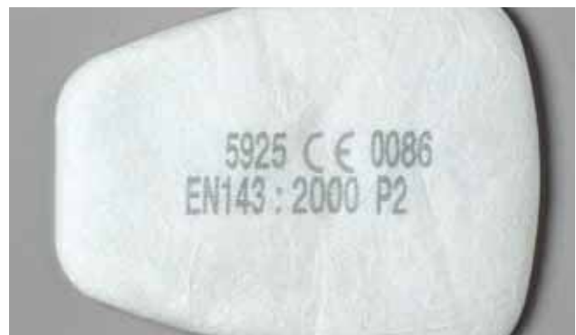
Foto 3: filtro con marchio CE e indicazione della norma e della classe del filtro

Per garantire la tutela della salute i respiratori devono essere conformi alle norme europee (vedi capitolo 5). Questi respiratori hanno una specifica marcatura: le maschere monouso e i filtri intercambiabili delle semimaschere sono dotati del marchio CE, con indicazione della norma corrispondente e della classe del filtro. Queste indicazioni sono riportate anche sull'imballaggio.