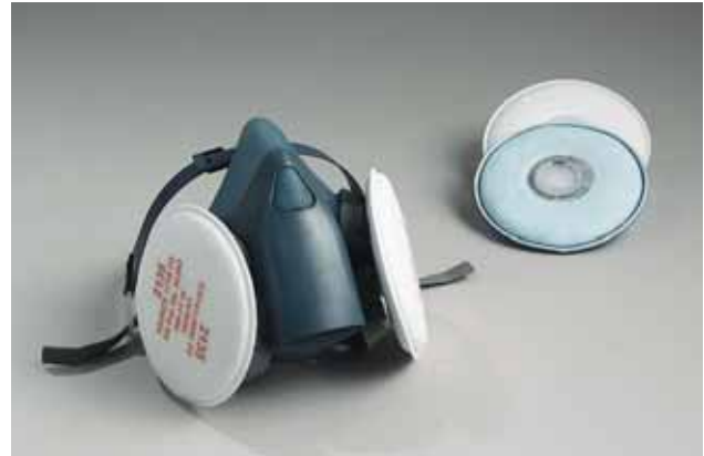
Foto 1: semimaschera con filtri intercambiabili di diverse classi di filtro conformi alla norma EN 143

I filtri sono riutilizzabili più volte e offrono maggiori vantaggi rispetto alle maschere monouso in termini di resistenza respiratoria.