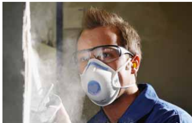
Foto 4: le maschere di classe FFP2 o P2 sono uno standard per molti lavori.

Molti lavori su materiali contenenti amianto possono essere svolti solo da ditte specializzate e riconosciute. Per maggiori informazioni su questo argomento vedi www.suva.ch/amianto .