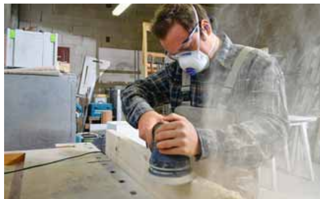
Foto 5: maschera FFP2 per la levigatura del legno. Se le polveri sono di faggio o quercia, è necessario usare sempre una maschera di classe FFP3 o un filtro P3.